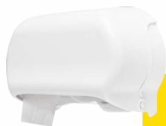
Clean White E401101