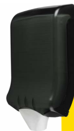
Modern Black E302112