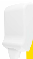
Clean White E302111