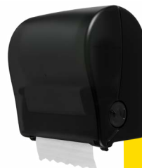
Modern Black E301102