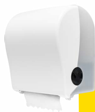
Clean White E301101