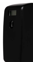
Modern Black E101102