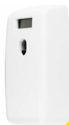
Clean White E101101